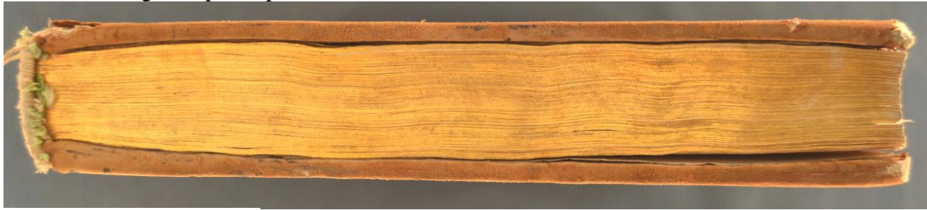
Tab. 2.D.I.3, taglio di piede.