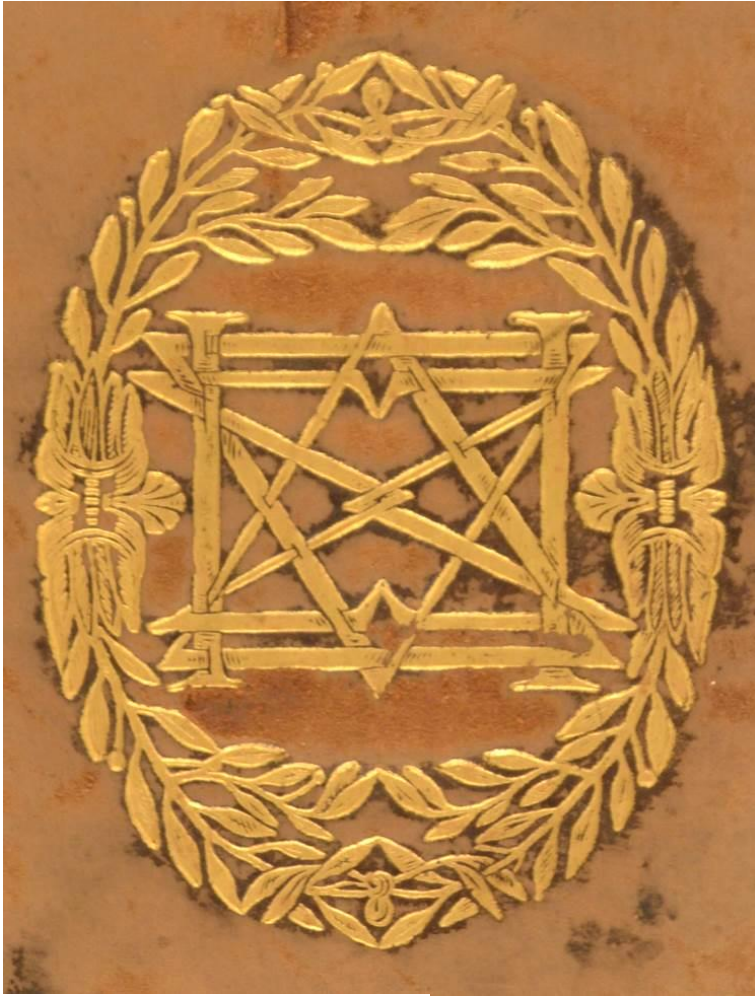
Tab. 2.D.I.3, particolare. Cfr. A.M.C.III.31, A.M.QQ.VI.26, A.V.AA.XVI.7, A.V.O.IX.21, A.V.R.IV.18; Bologna, Biblioteca civica dell'Archiginnasio, 4.LL.II.21, 5.b.I.15, 5.C.II.14, 5.G.I.1/2, 5.S*.I.13, 7.Y.I.9, 16.h.II.25.