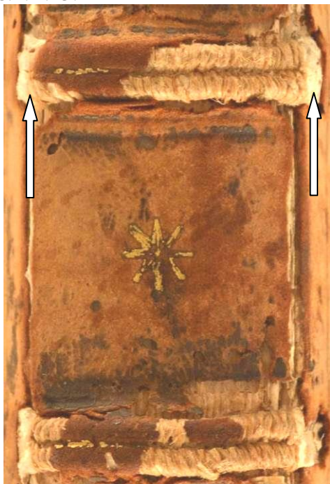
2 Tab. 2.D.I.3, particolare.